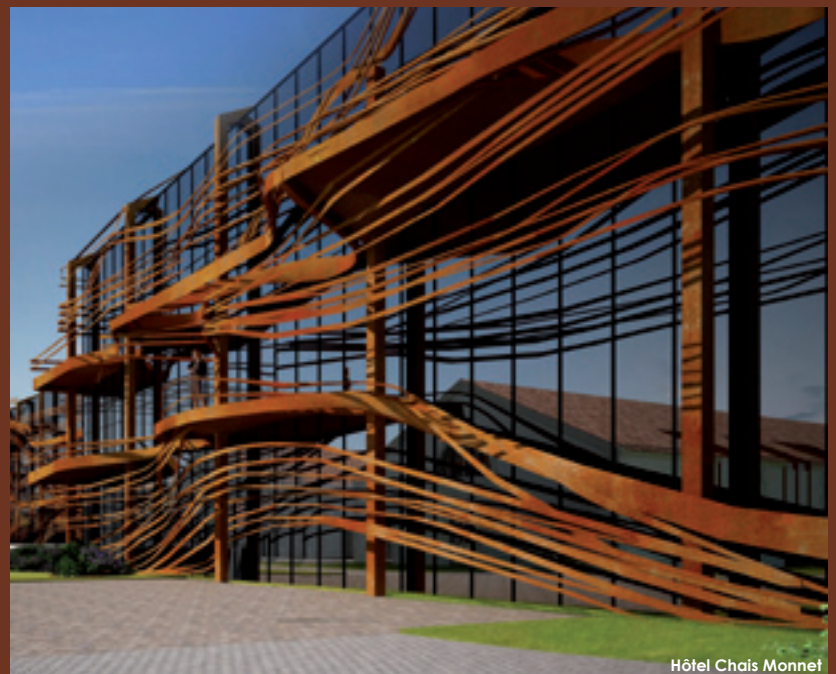
Hôtel Chais Monnet