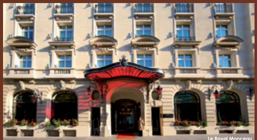
Le Royal Monceau