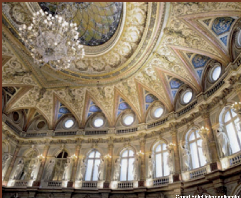
Grand Hôtel Intercontinental