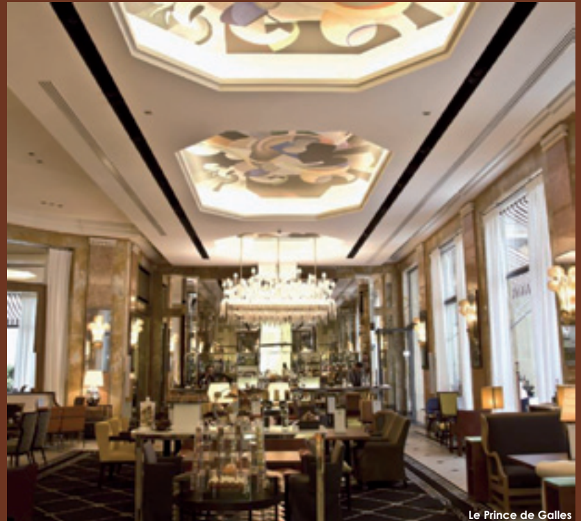
Le Prince de Galles